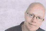
door Hein Eikenaar

Wie straks Cinecitta bezoekt, kan met eigen ogen een stukje historie aanschouwen. 'Die engeltjes in het plafond gaan veel mooier uitkomen.'