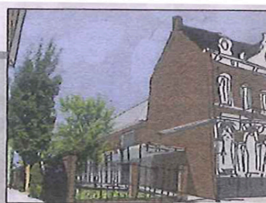
Bron Van Hoogmoed Architecte

Het grote sloopwerk is gedaan in Cinecitta en Ruimte-X. Er wordt weer opgebouwd aan de Willem II-straat.